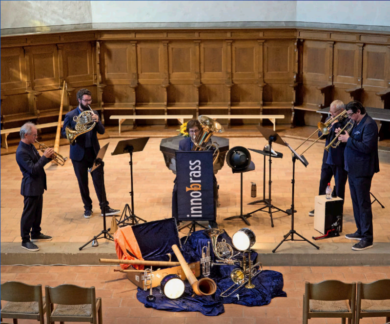
Innobras Ensemble anl. Konzert in der Dorfkirche Steffisburg vom 2. Juni 2023.