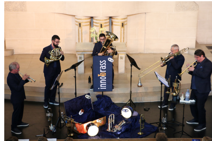
Innobrass Ensemble anl. Konzert in der Pauluskirche Bern vom 10. September 2023.